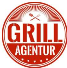
Live Grillkurs RAFI (kleines Menü) (Rind) 19,90 €

(rote Logos = Rind; schwarze Logos = Schwein)