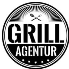
Live Grillkurs RAFI (kleines Menü) (Schwein) 19,90 €