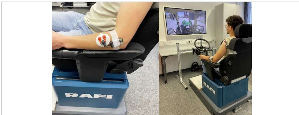
Bild 1: Am RAFI-Simulator werden die muskulären Belastungen bei der Lenkrad- und Joysticklenkung mittels Elektromyografie gemessen.

Neuartigkeit höhere Zufriedenheitswerte als das seit Jahrzehnten etablierte Lenkrad, was für seine gute Bedienung und intuitive Nutzung spricht. Die Kombination aus deutlich reduzierter körperlicher Arbeitsbeanspruchung und hoher Anwenderzufriedenheit macht die Joystick-Lenkung zu einer vielversprechenden Alternative für die Zukunft der Landtechnik.